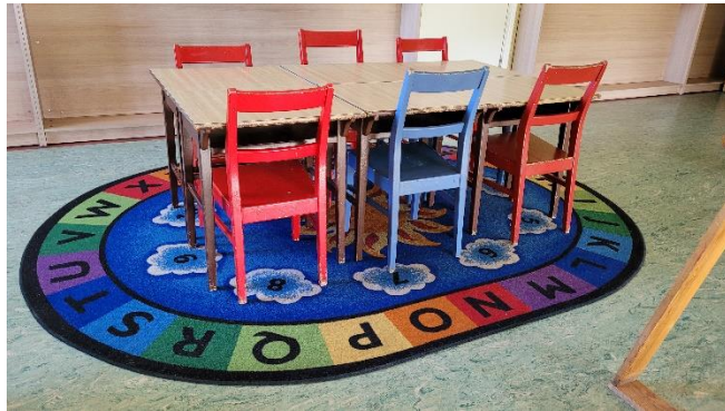
Patraukli mokymosi aplinka pagrindinėje mokykloje

Kursų dalyviai taip pat supažindinti ir su Islandijos švietimo sistema. Islandijoje vaikai mokyklą pradeda lankyti nuo 6 metų. Nuo 1 iki 4 klasės jie mokosi pradinėje, o nuo 5 iki 9 klasės lanko pagrindinę mokyklą. Vėliau renkasi lankyti gimnaziją arba stoti į profesinio rengimo mokyklą, kuriose, kaip ir gimnazijoje, mokosi dar trejus metus, o vėliau dvejus metus praleidžia atlikdami praktiką.