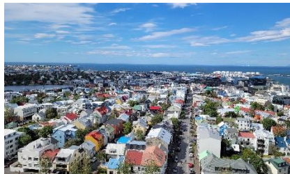
Reikjaviko spalvotieji nameliai

Nuo paskaitų ir užsiėmimų likusiu laiku kurso dalyviai keliavo po turistų gausiai lankomas vietas. Kurso organizatoriai dalyviams surengė net dvi skirtingų maršrutų išvykas, kurių metu aplankyti žymieji Islandijos gamtos perlai – Tingvedliro nacionalinis parkas, įstabusis geizerių parkas, žadą gniaužiantys kriokliai ir vandenkričiai, Kediro krateris, abejingų nepaliekantys ir mistika alsuojantys ledynai bei lavos paplūdimiai, pakelėse besiganančios avys ir Islandijos žirgai. Pasivaikščiojimo po Reikjaviką metu patyrėme, kokia spalvinga, jauki ir draugiška yra vos 120 tūkstančių gyventojų turinti Islandijos sostinė.