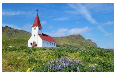
Vik miestelis Islandijos pietuose

Islandijos švietimo sistema grįsta šiais principais – aukštas gyventojų raštingumo lygis, į tvarumą orientuotas švietimas, piliečių lygybė, mokinių sveikatinimas ir gera savijauta, demokratijos ir žmogaus teisių užtikrinimas bei kūrybiškumo ugdymas. Islandijos mokyklos vadovaujasi moto „Mokykla visiems“, todėl jose mokosi visi tam tikro amžiaus sulaukę vaikai, nepriklausomai nuo jų rasės, tikėjimo, socialinio sluoksnio, įsitikinimų ir kt. Tačiau, jei klasėje mokosi specialiujų poreikių turintis mokinys, už jo ugdymą klasėje yra atsakingas tam skirtas specialistas, o ne mokytojas. Islandijos mokykloms pedagogus ruošia šalies universitetai, kuriuose pedagoginį išsilavinimą įgyti užtrunka 5 metus. Šiuo metu vidutinis mokytojų amžius Islandijos mokyklose yra 45 metai.