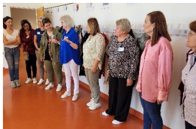
Praktinių užsiėmimų metu patirtos džiaugsmo akimirkos

Kursų tikslas – įvaldyti projektinės veiklos ugdymo procese organizavimo metodus ir formas kaip inovatyvių metodų taikymo galimybes šiuolaikinei pamokai kurti. Kursų dalyviai savaitę trukusių teorinių ir praktinių užsiėmimų metu įvaldė pagrindinius projektinės veiklos pamokoje taikymo būdus, skatinančius moksleivių savivaldų mokymąsi, smalsumą ir motyvaciją, tarpdalykinę integraciją, bendradarbiavimo darbo grupėse gebėjimus, vertinimo ir įsivertinimo gebėjimus ir svarbą bei kuriančius pridėtinę vertę mokyklos ir vietos bendruomenėse.